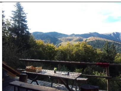
Vue de la terrasse