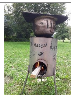
Le rocket stove

UN ENFER POUR CEUX QUI TIENNENT A LEUR CONFORT !