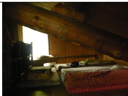
Le coin dodo