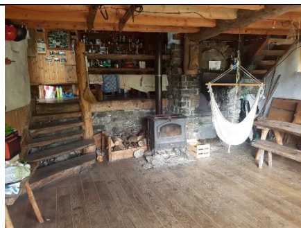
La salle commune